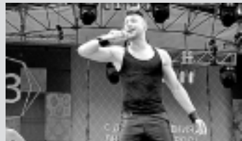
С программой празднования Дня города вы можете познакомиться на 4-й стр.

Порт дарит всем жителям фейерверк и концертную программу звезды Российской эстрады Сергея Лазарева.